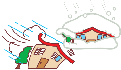
台風や大雪による被害