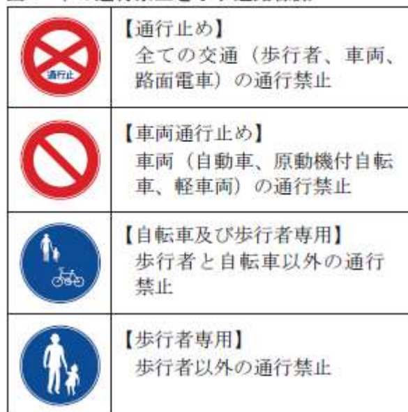
図2 車の通行禁止を示す道路標示